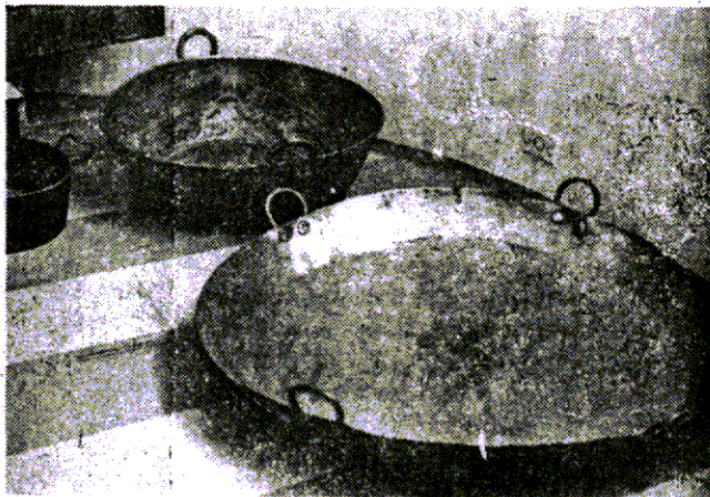
Os tachos para o Museu de Jacareí

Portanto, as imagens adquiridas pela prefeitura jacareense são desta escola do artesanato. Prossegue o culturalista, salientando que paulistinhas são as "imagens populares características de São Paulo, feitas aos milhares, de todos os tamanhos, desde as miniaturas de Nossa Senhora da Conceição, de 6 cm, até as grandes peças de igrejas de 70 cm. Sua feitura variou com a sucessão de santeiros. Foram feitas a princípio com o que chamamos "moldes de vulto", isto é, um molde grosseiro que exigiu um acabamento individual, do que resultou não haver praticamente imagens idênticas. Semelhante sim, mas não iguais, pois sempre há um detalhe, uma dimensão que as diferencia de alguma forma".